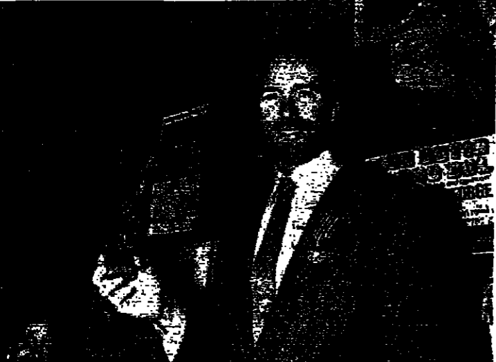
كليت لستودو وعكس الوسام

بدأت مكان، كزوج بسطعها الشهيرة، شهرة شجرات النخيل البسطة التي تزين شارعها الرئيس، كروازيت، والتي قبل انه جيه بها من بلد عربي معروف بنخيله.